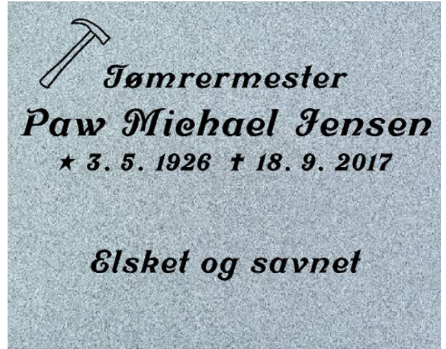
Granittype – Finsk grå Skrifttype - Skriveskrift