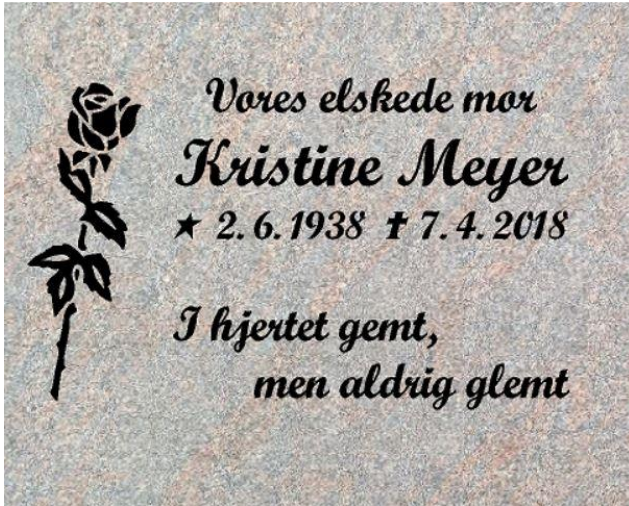
Granittype - Halmstad Skrifttype - Script