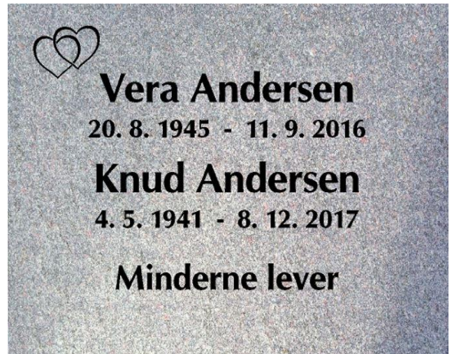
Granittype – Orion Skrifttype – Omega Bold