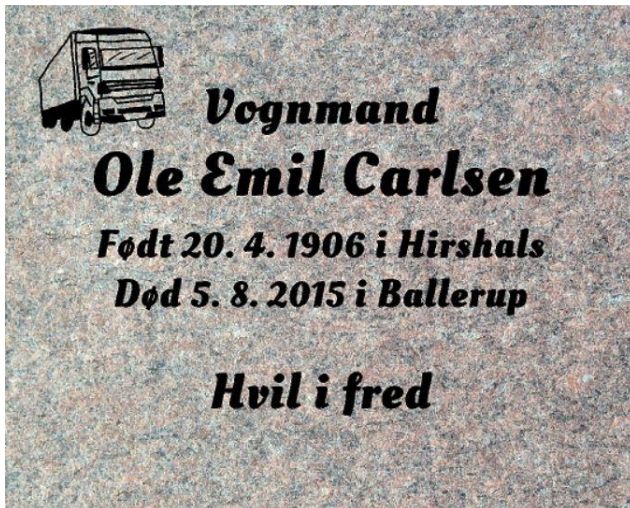
Granittype – Vånga Skrifttype - Classico